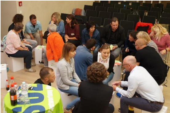
Mit Netzwerken Herausforderungen begegnen