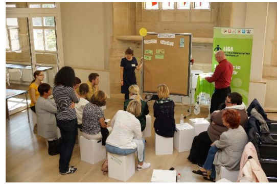
Interessen berücksichtigen – Jung und Alt im Quartier