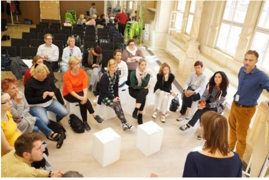
Soziale Arbeit im Quartier – politisch oder nicht?